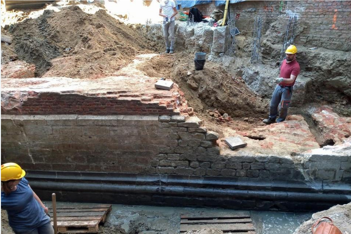
De opgegraven muur in de Gijzelaarsstraat is een fragment van het Alva-bastion