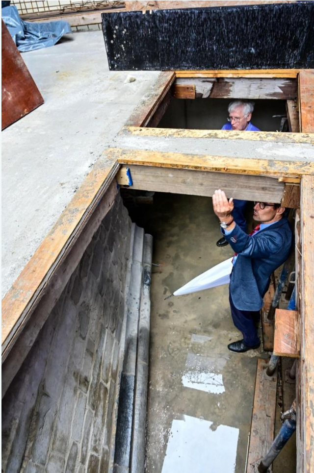
De blauwe steen geeft de waterlijn van de grachten rondom de citadel aan.